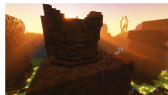
Platz 3: nukoolar