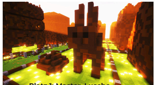
Platz 1: Master_Lusche

Gestern wurde das SCHNITZ-IT-Event nachgeholt, welches wegen technischer Probleme nicht wie geplant am Mittwoch stattfinden konnte. Hier die Gewinner-Bilder: