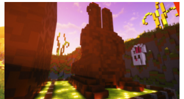
Platz 2: guad4lx